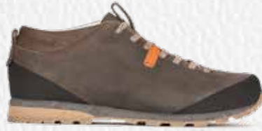
BELLAMONT II PLUS