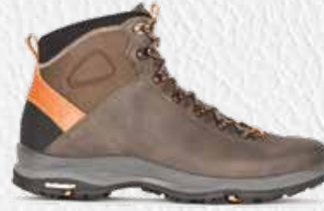
LA VAL II PLUS