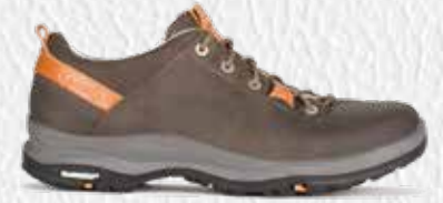
LA VAL LOW PLUS