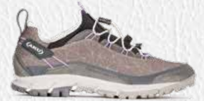
LIBRA PLUS W'S