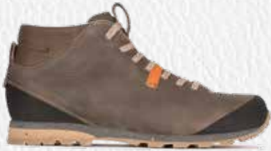
BELLAMONT II MID PLUS