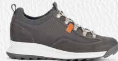
RIVA PLUS W'S