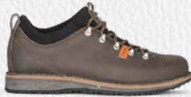
BADIA LOW PLUS