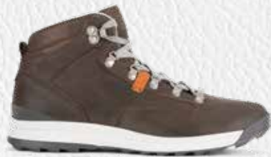
LEDRO MID PLUS